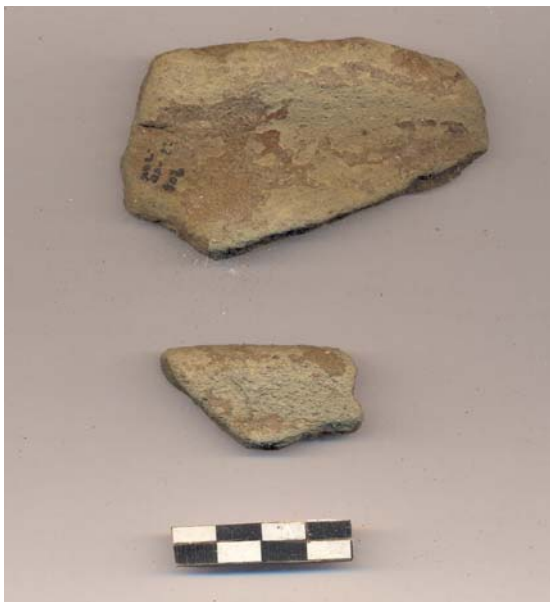
Figura 55.- Muestra de material cerámico del grupo Xanaba recuperada en la tercera temporada de campo de Xoclan.