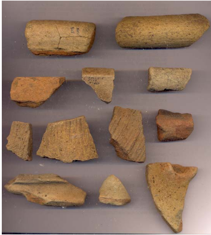
Figura 62.- Muestra de material cerámico del grupo Muna recuperada en la tercera temporada de campo de Xoclan.