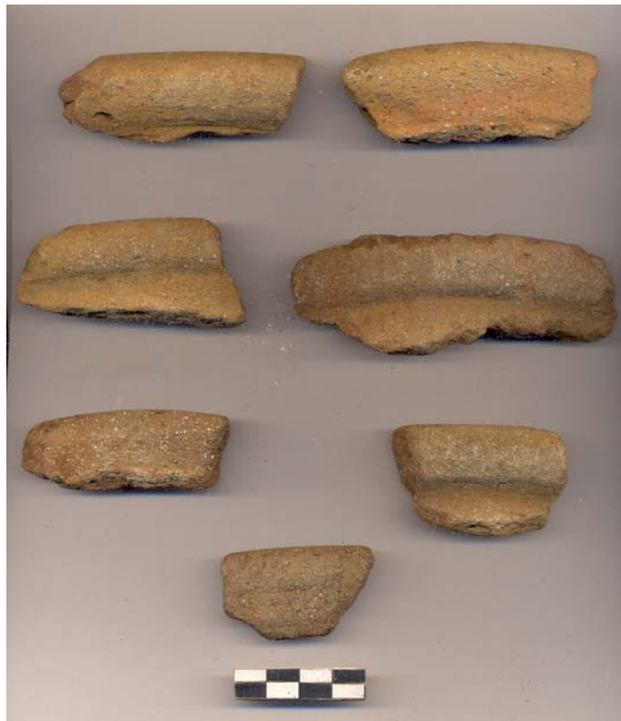
Figura 57.- Muestra de material cerámico del grupo Oxil recuperada en la tercera temporada de campo de Xoclan.

Fueron identificados también bordes de cazuelas y platos trípode del grupo Muna (Fig. 62 y 63) y fragmentos de cuerpo de cajete del grupo Ticul, estos se incluyen en el horizonte Cehpech (550/1100 d. C.) en el Clásico Tardío y Terminal. Para el periodo Postclásico (1100 - 1543) fueron identificados muy pocos fragmentos de olla pertenecientes al grupo Navulá muy erosionados.