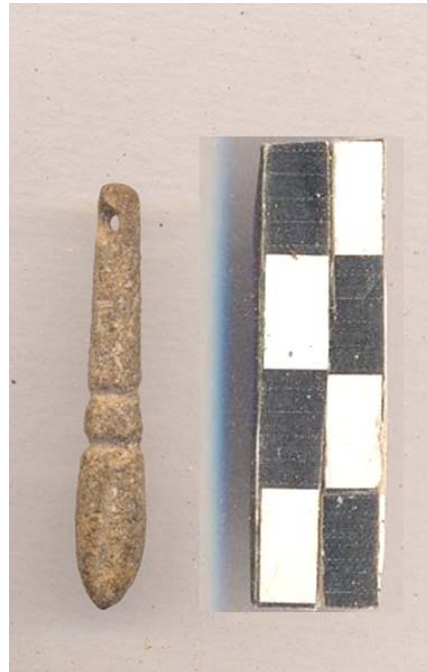
Figura 50.- Pendiente en forma de pincel elaborado en concha recuperado en la Operación 28.