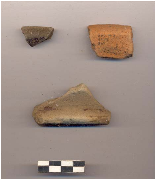
Figura 60.- Muestra de material cerámico del grupo Batres recuperada en la tercera temporada de campo de Xoclan.