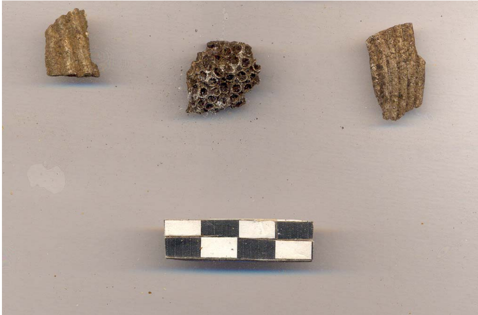
Figura 48.- Muestras de materiales malacológicos recuperados en los pozos de sondeo excavados en Xoclan, correspondientes a dos fragmentos de concha bivalva y un fragmento de fósil de esponja al centro