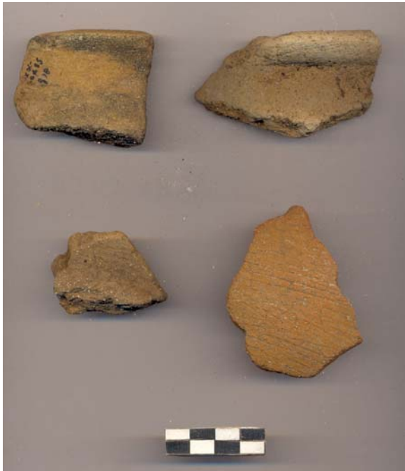
Figura 53.- Muestra de material cerámico del grupo Típkal recuperado en la tercera temporada de campo de Xoclan.