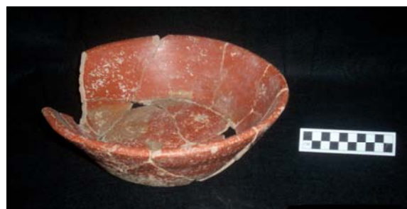
Figura 52.- Ejemplo de cajete del grupo Juventud proveniente del sitio arqueológico de Causal.