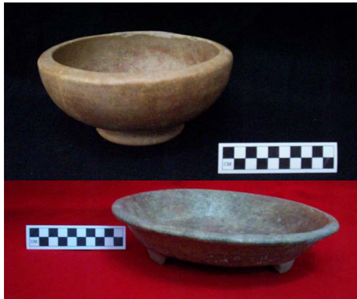
Figura 63.- Ejemplo de cajete (Arriba) y Plato (Abajo) del grupo Muna provenientes de Caucel.