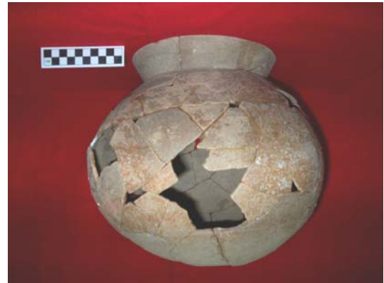
Figura 59.- Ejemplo de Olla Maxcanu proveniente de Caucel (Foto Proyecto Ciudad Caucel, INAH).