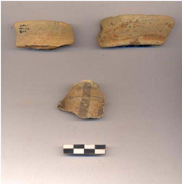
Figura 58.- Muestra de material cerámico del grupo Maxcanú recuperada en la tercera temporada de campo de Xoclan.