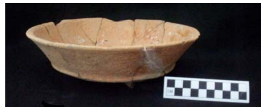
Figura 61.- Ejemplo de Cajete Batres proveniente de Caucel.