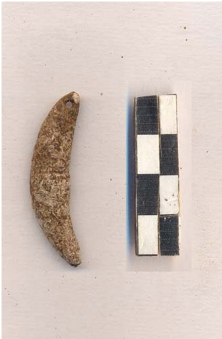
Figura 49.- Pendiente elaborado en piedra caliza recuperado en la Operación 26