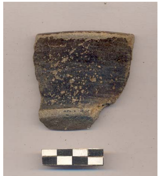
Figura 56.- Muestra de material cerámico del grupo Polvero recuperada en la tercera temporada de campo de Xoclan.