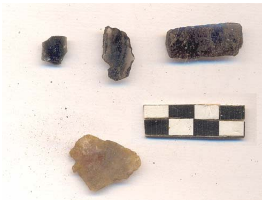
Figura 47.- Muestras de materiales líticos recuperados en los pozos de sondeo excavados en Xoclan, destacan los fragmentos de Obsidiana Gris proveniente del Chayal y un fragmento de Silex Café

Hasta el momento se han identificado cinco lascas de obsidiana de color gris provenientes del Chayal en Guatemala y un fragmento de Silex café (Fig. 40), 11 bolsas de estuco, 7 bolsas de tierra provenientes de la muestra tomada por niveles métricos. También se identificaron seis fragmentos de concha bivalva y un fragmento de esponja fosilizada (Fig. 41), y dos fragmentos de carbón. Entre los materiales destacaron por su singularidad dos elementos ornamentales de collar, el primero de ellos encontrado en la Operación 26, fue elaborado en hueso con forma de media luna que presentó trabajo inciso formando un patrón de red (Fig. 42) y el segundo recuperado en al operación 28 fue elaborado en concha con forma de pincel y decoración incisa (Fig. 43). El material que se presentó con más abundancia en todas las operaciones fue la cerámica de la cual se recuperaron un total de 1010 fragmentos.