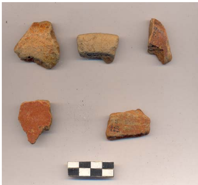
Figura 51.- Muestra de material cerámico del grupo Juventud recuperada en la tercera temporada de campo de Xoclán.

Con temporalidad del periodo Clásico Temprano se identificaron bordes de ollas Oxil (Fig. 57), Maxcanú y Chuburná, igualmente escasos fragmentos de cajetes del grupo Batres y Maxcanú (Fig. 58 a 61 ) todos ellos incluidos en el horizonte Cochuah (250-550 d. C.).