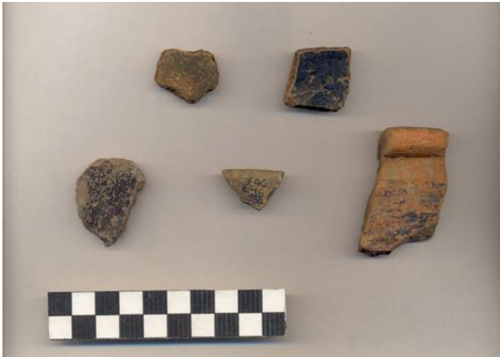
Figura 81.- Muestra de Cerámica Preclásica del Grupo Chuhuinta. La muestra proviene de la Operación 5 del Grupo Sur.