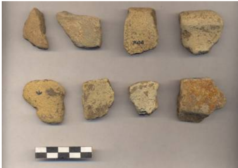
Figura 77.- Muestra cerámica del grupo Sanaba recuperada en la Operación 5 del Grupo Sur.