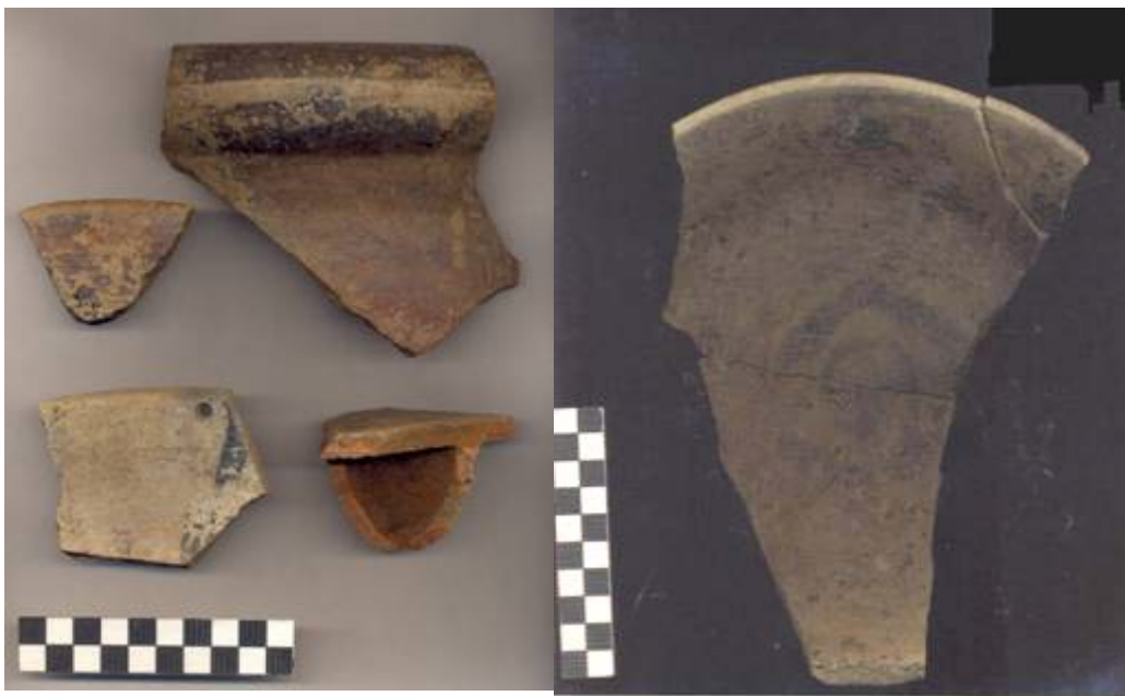
Figura 66.- Muestra cerámica del grupo Muna recuperada en al operación 1 del grupo Norte. En la imagen de la izquierda se observan un borde de olla y dos de cajetes, así como un soporte fragmentado. A la derecha, el cajete recuperado en superficie cerca de la estructura 3 Norte.