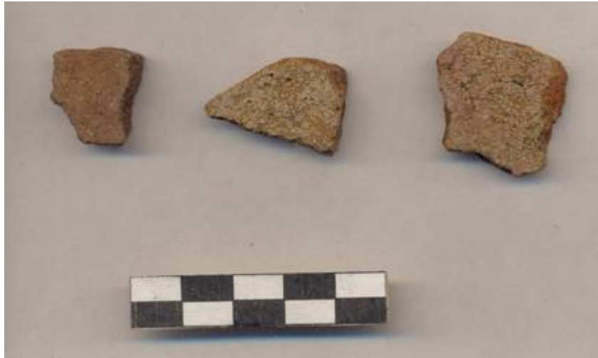
Figura 65 .- Muestra cerámica del grupo Dzitas recuperada en la operación 4 en el Grupo Norte.