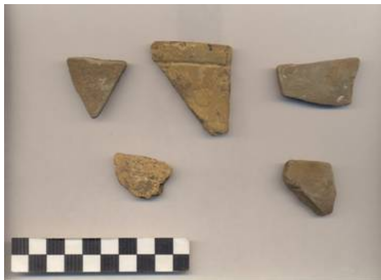
Figura 70.- Muestra cerámica del grupo Chablekal recuperada en la Operación 4 del Grupo Norte.