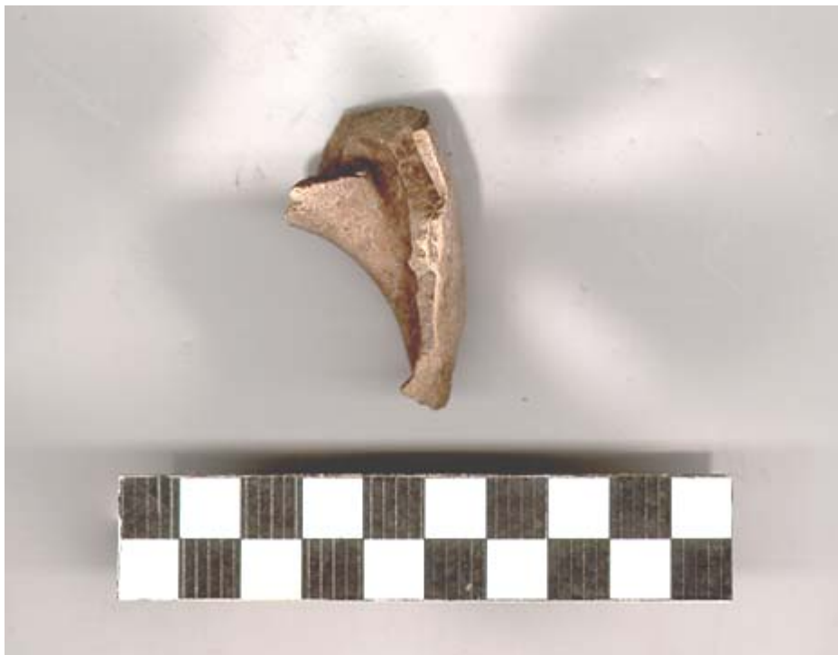
Figura 88.- Fragmento de caracol recuperado en la Operación 2 del Grupo Norte.