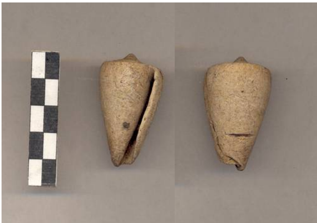
Figura 84.- Caracol trabajado recuperado en el pozo de la Operación 2.