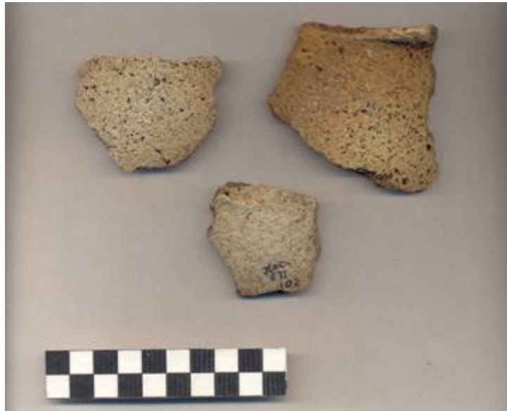
Figura 63 .- Muestra cerámica del grupo Nabulá recuperada en superficie durante la operación 1 al pie de la estructura 1 del Grupo Norte.