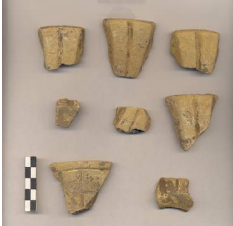
Figura 67.- Muestra cerámica del grupo Ticul recuperada durante la excavación de la operación 4 en el Grupo Norte.