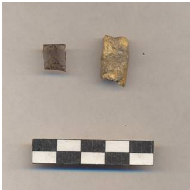
Figura 86 .- Fragmento de obsidiana gris veteadada y una falange recuperada en la capa VI de la Operación 2 del Grupo Norte.