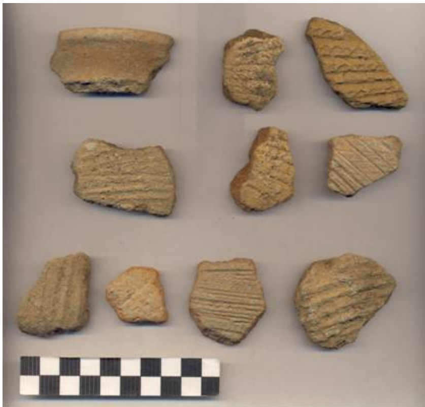
Figura 74.- Muestra Cerámica del grupo Oxil recuperada en la Operación 5 del Grupo Sur.