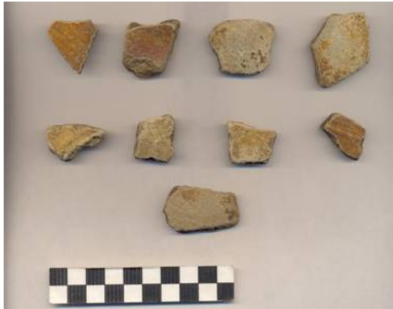
Figura 69.- Muestra cerámica del grupo Chuburná recuperada durante la excavación del pozo de la Operación 4 del Grupo Norte.