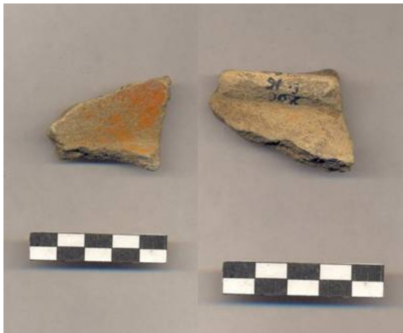
Figura 76 .- Tiesto cerámico perteneciente al Grupo Timucuy recuperado en la operación 6 del Grupo Sur. (Foto Archivo DPANM).