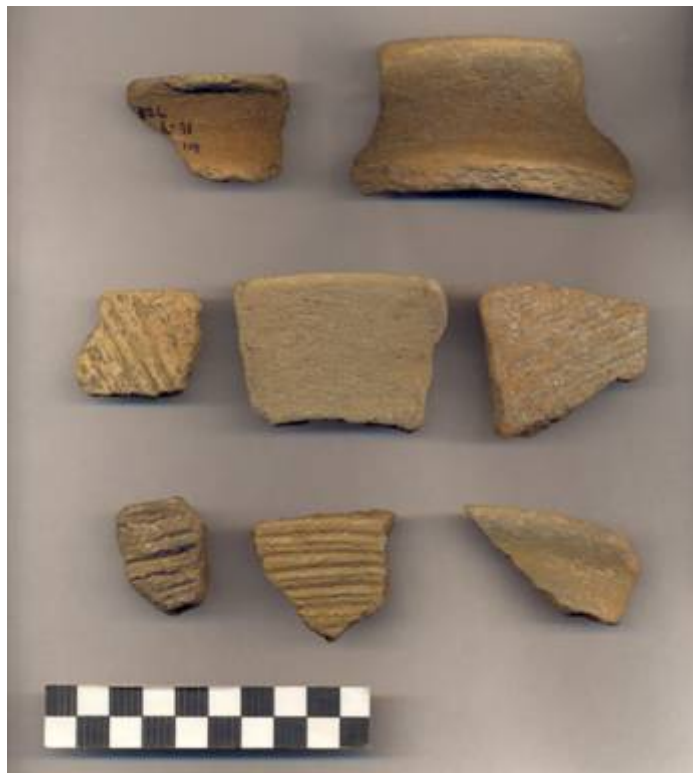
Figura 80.- Muestra Cerámica del Grupo Tipikal recuperada en la excavación del pozo de la Operación 5 del Grupo Sur.