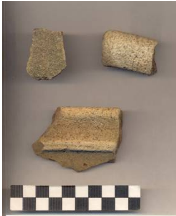
Figura 75.- Muestra cerámica del Grupo Maxcanú recuperada en superficie sobre la Estructura 3 del Grupo Norte. (Foto Archivo DPANM).