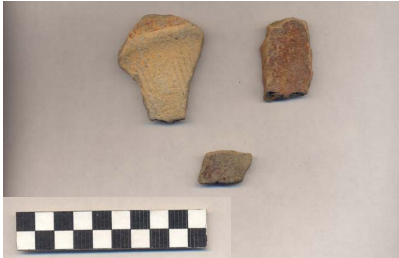
Figura 78.- Muestra Cerámica del Grupo Sierra recuperada durante la excavación del pozo de la Operación 5 del Grupo Sur.