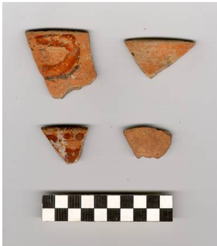
Figura 72.- Muestra cerámica del grupo Saxche recuperada en la operación 4 del Grupo Norte. (Foto Archivo DPANM).