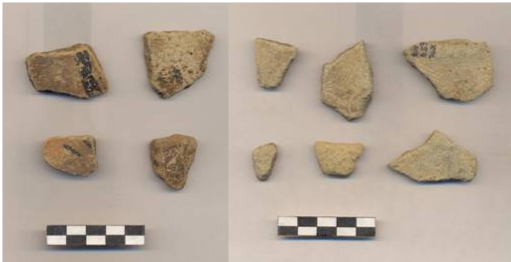
Figura 64 .- Dos muestras cerámicas del grupo Kukula. La muestra de la izquierda corresponde a la variedad Xcanchakan recuperada en la operación 4 del grupo Norte. La muestra de la derecha se recuperó en la operación 7 también en el grupo Norte.