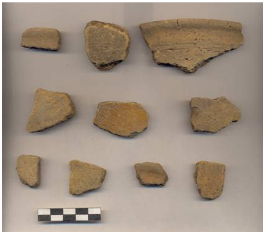
Figura 82.- Muestra cerámica del Grupo Dzudzuquil recuperada en la excavación de la Operación 3 del Grupo Sur.