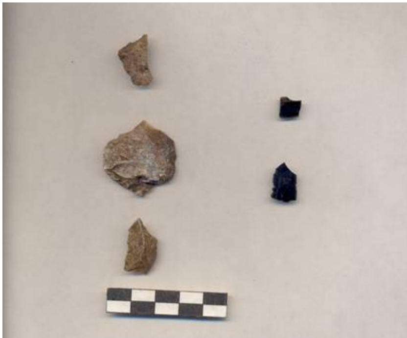
Figura 87.- Fragmentos de obsidiana gris veteadada y Silex recuperados en la Operación 2 del Grupo Norte.