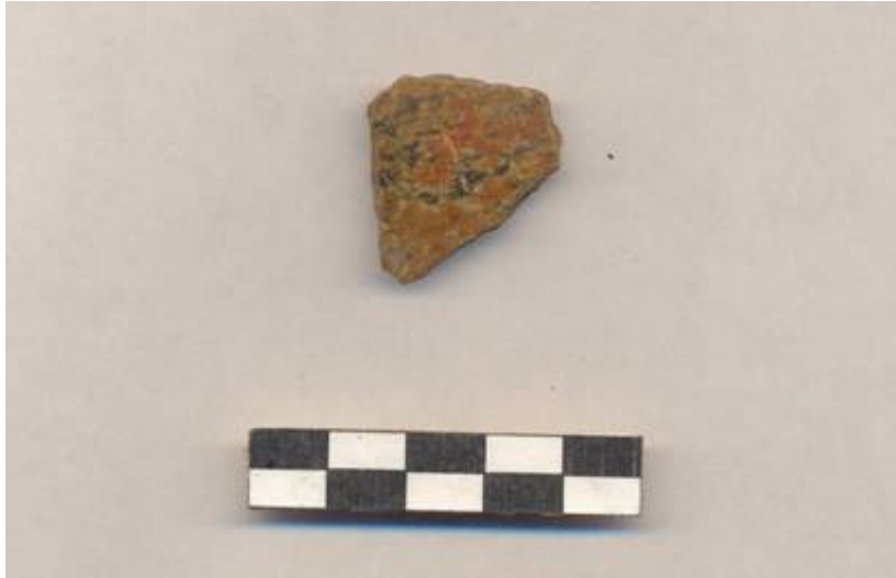
Figura 73.- Tiesto cerámico perteneciente al grupo Batres recuperado en el nivel D de la Operación 2 del Grupo Norte. (Foto Archivo DPANM).