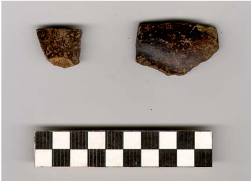
Figura 71.- Ejemplos de cerámica del grupo Yalcox recuperadas en el pozo de la Operación 4 del grupo Norte.