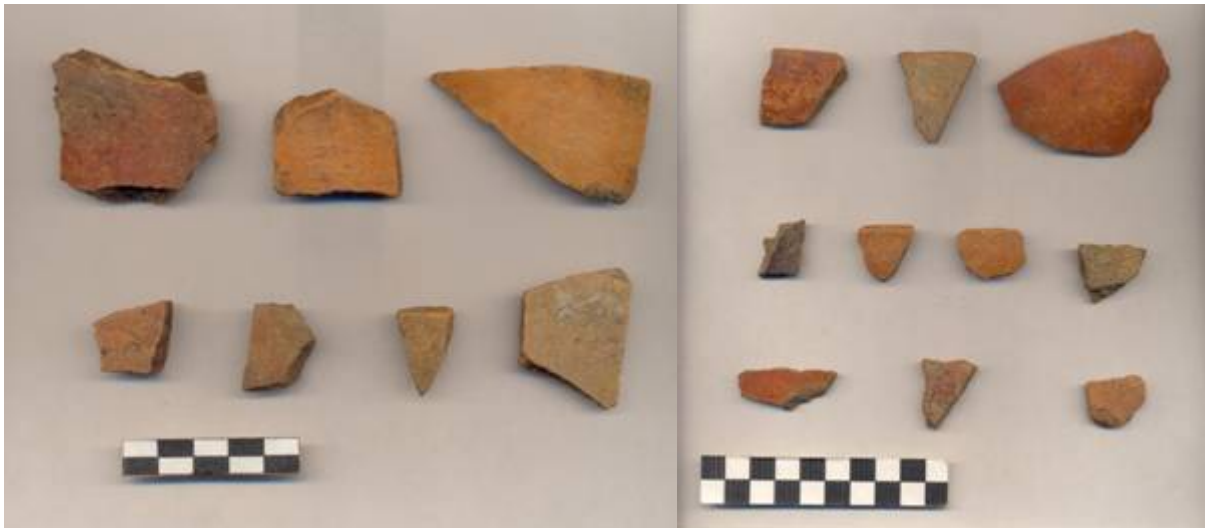
Figura 68.- Muestras cerámicas del grupo Teabo. La muestra de la izquierda corresponde al material recuperado en la operación 5 del Grupo Sur y la de la derecha corresponde al material recuperado en la operación 4 del Grupo Norte.