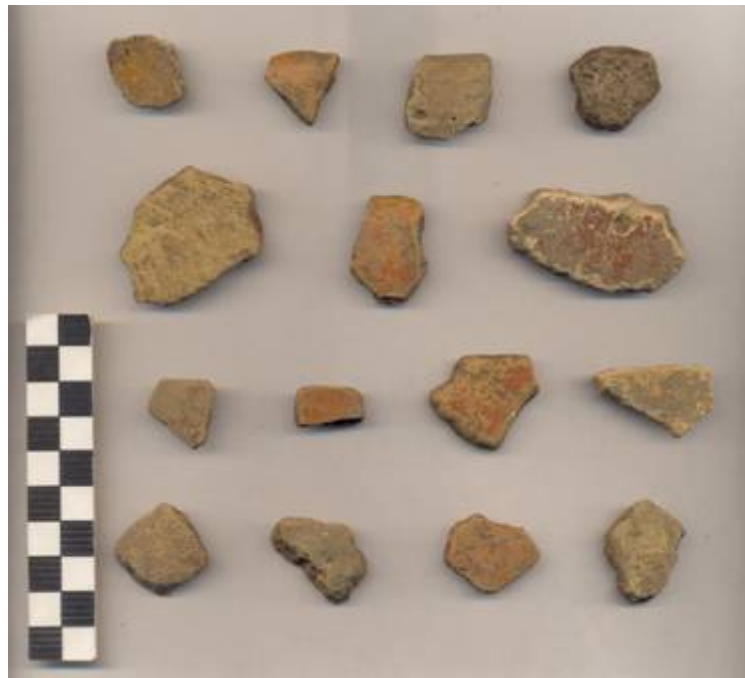
Figura 83.- Muestra cerámica del grupo Joventud recuperada en la Operación 4 del Grupo Sur. (Foto Archivo DPANM).