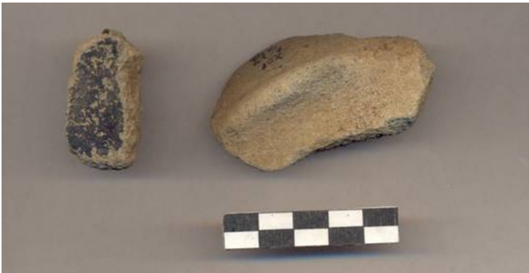
Figura 79.- Muestra cerámica del Grupo Polvero recuperado en la Operación 3 del grupo Sur. (Foto Archivo DPANM).