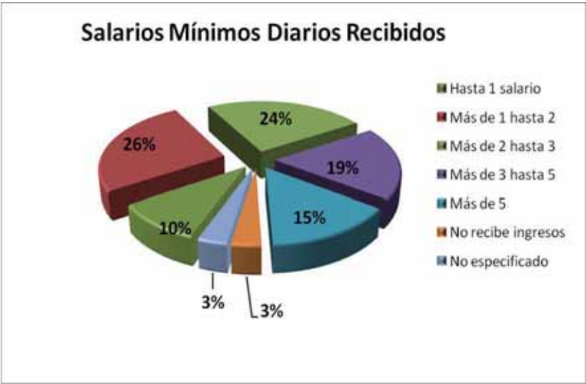
Gráfica 4. Salarios mínimos diarios recibidos por persona por trabajo realizado en el Municipio de Mérida

La remuneración diaria y semanal se muestra en las gráficas 4 y 5, donde señalan los salarios mínimos diarios recibidos.