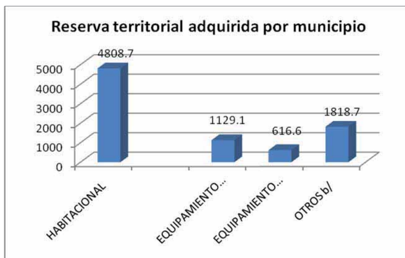
Gráfica 1. Reserva territorial adquirida por Municipio.

La reserva territorial del Municipio es de 8,639.4 hectáreas, en la siguiente gráfica se especifica la distribución: