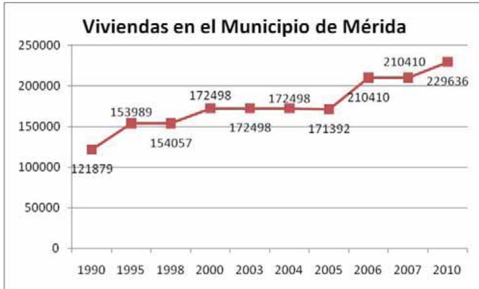
Gráfica 8. Crecimiento de las viviendas en el Municipio de Mérida

La vivienda representa entre el 15 y el 40% del gasto mensual de los hogares en todo el mundo (Cooperación Financiera Internacional. C.F.I.).