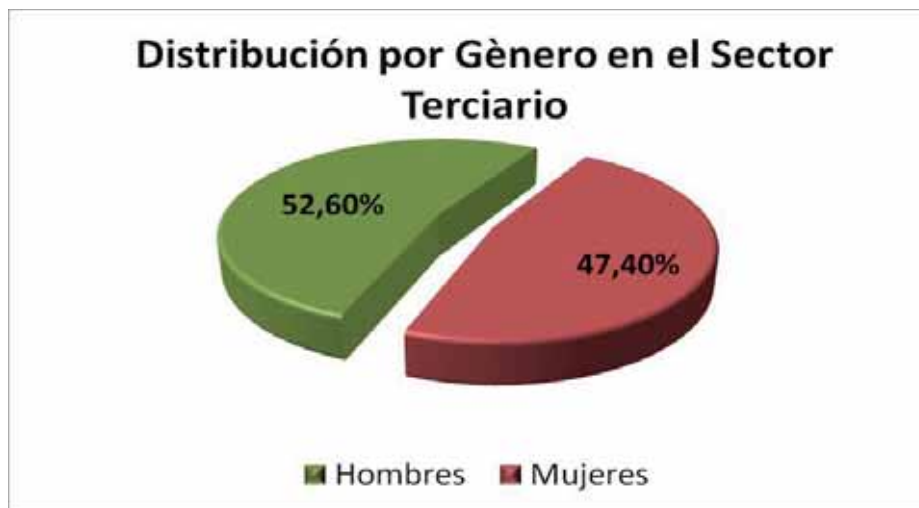
Gráfica 3.- Distribución por género en el sector terciario de la economía

La mayor parte de la población económicamente activa del Municipio recibe una remuneración por su trabajo entre 2 y 3 salarios mínimos, siendo la jornada más común de 35 a 48 horas durante la semana calendario teniendo usualmente como día de descanso el domingo.