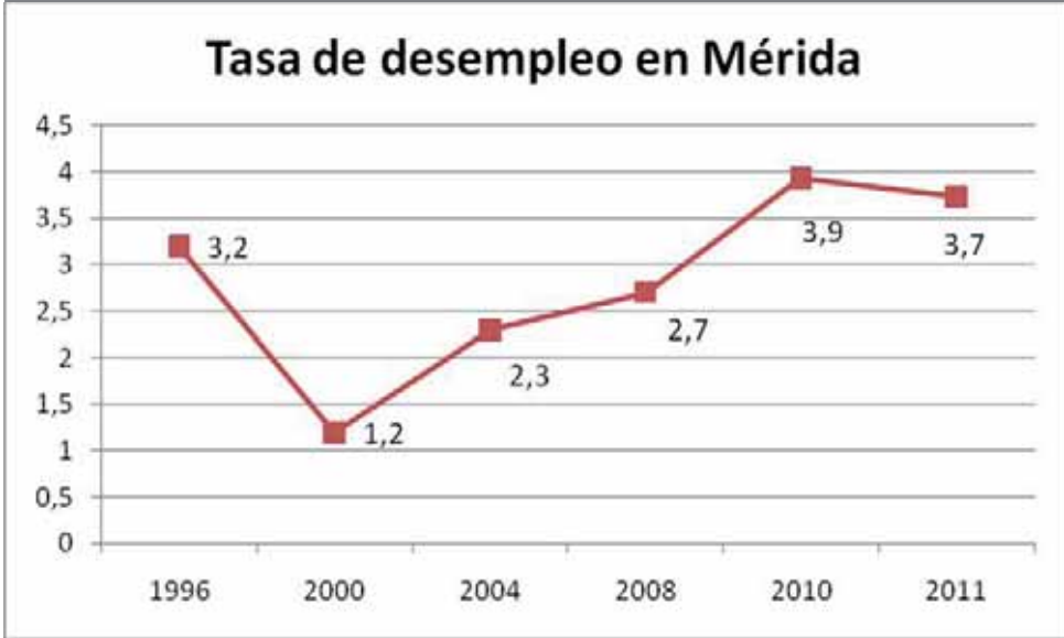
Gráfica 6.- Tasa de desempleo entre 1996 y 2011 en el Municipio de Mérida

En la gráfica 6, se muestra la tasa de desempleo a partir de 1996 hasta el tercer trimestre del 2011, dentro del Municipio de Mérida.